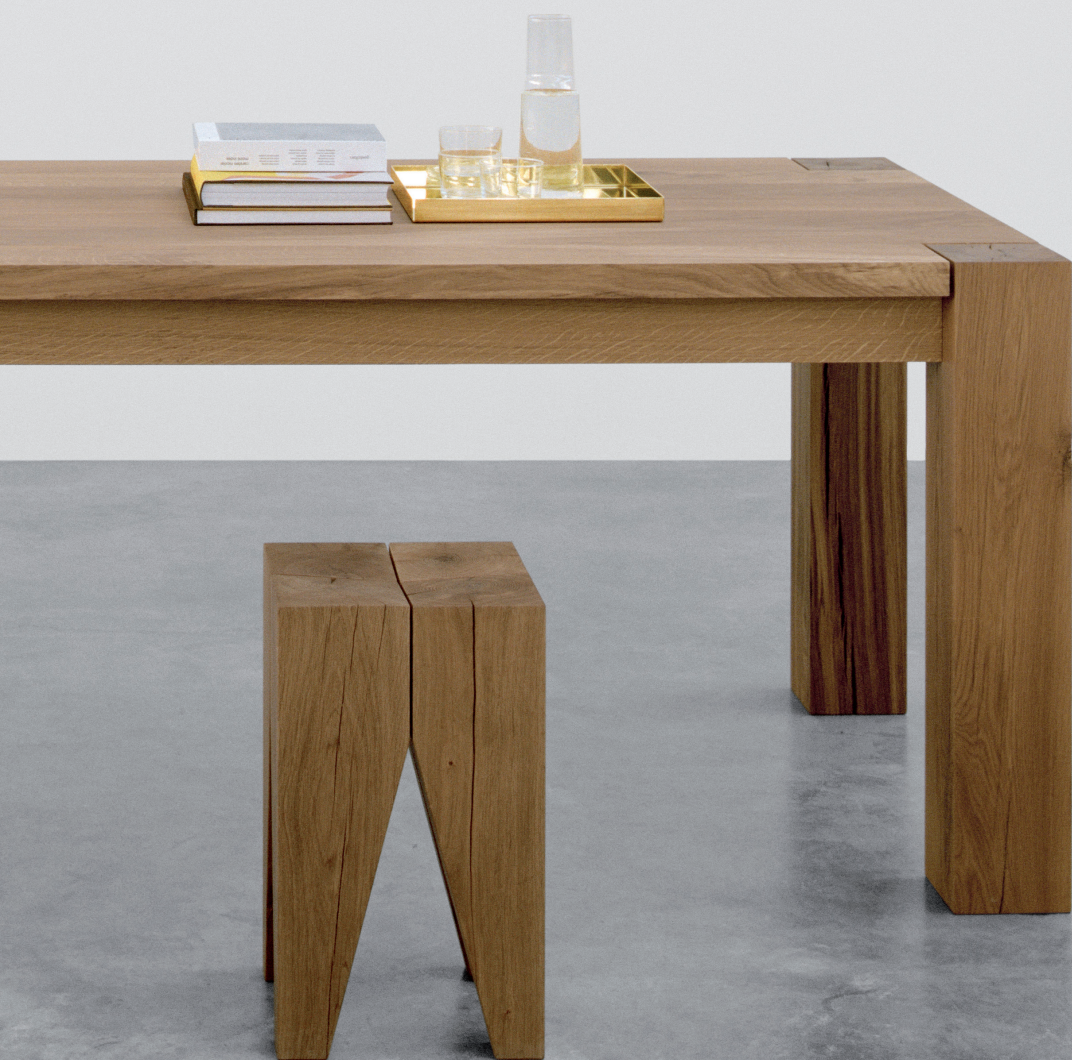
CM04 ITO TABLETT / TRAY MESSING, POLIERT / BRASS, POLISHED TA04 BIGFOOT™ TISCH / TABLE ST04 BACKENZAHN™ HOCKER / STOOL