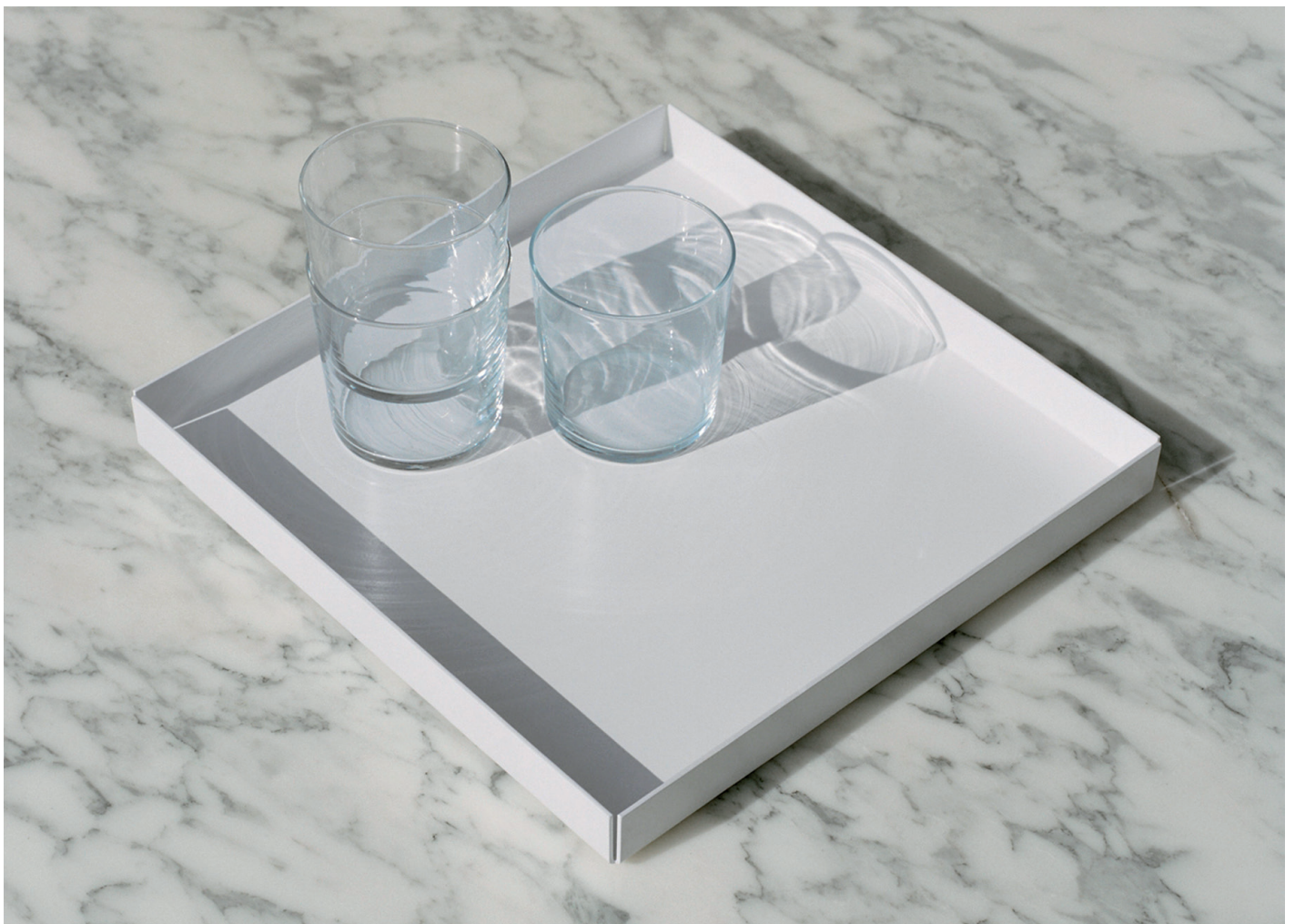
CM04 ITO TABLETT / TRAY ALUMINIUM, PULVERBESCHICHTET / ALUMINIUM, POWDER-COATED