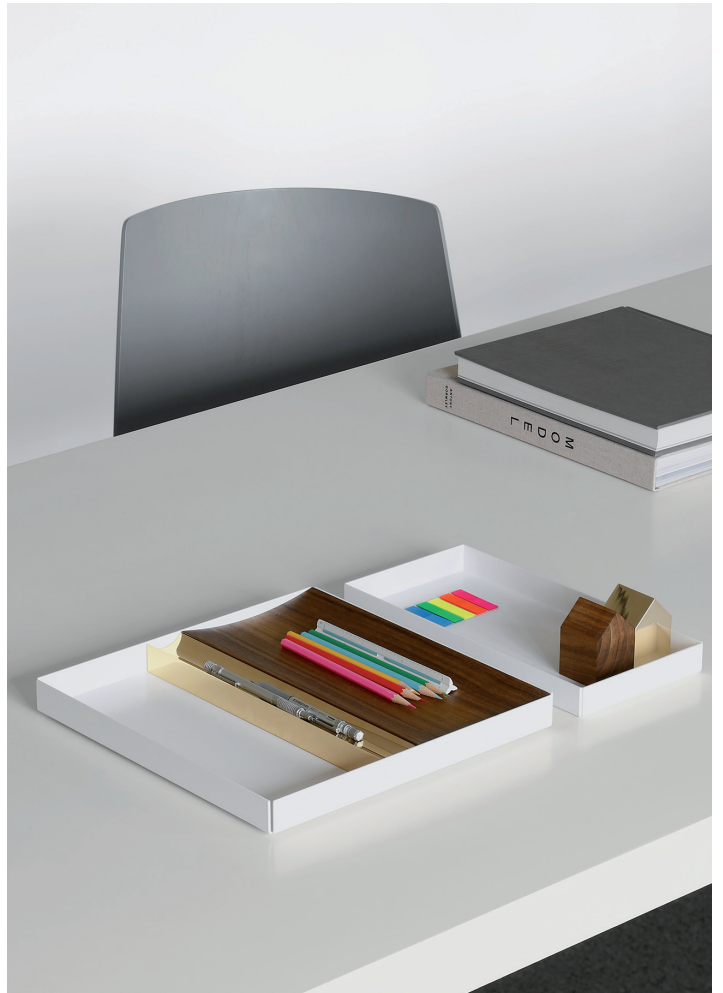
CM04 ITO TABLETT / TRAY ALUMINIUM, PULVERBESCHICHTET / ALUMINIUM, POWDER-COATED AC10 HAUS BRIEFBESCHWERER / PAPER WEIGHT AC12 PEN SCHALE / TRAY