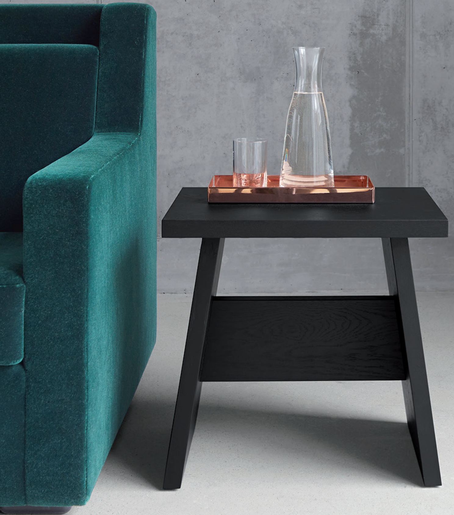
CM04 ITO TABLETT / TRAY KUPFER, POLIERT / COPPER, POLISHED DC03 LANGLEY HOCKER, BEISTELLTISCH / STOOL, SIDE TABLE